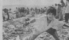
"Vivir" refleja el entorno cotidiano donde trabajan los pepeñadores.