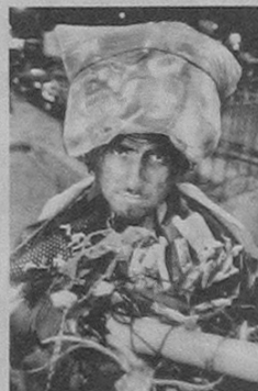
"Sin título" muestra la apariencia sucia que caracteriza al pepeñador.