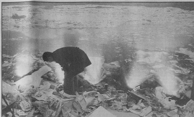
El fotomural donde se aprecia el Lago de Texcoco lleno de basura es una de las instalaciones que integran la exposición.

El CIC, que tiene representación de Antigua y Barbuda, Argentina, Bahamas, Bolivia, Brasil, Canadá, Chile, Colombia, Costa Rica, Ecuador, El Salvador, Estados Unidos, Guatemala, Haití, Honduras, México, Nicaragua, Panamá, Paraguay, Perú y Venezuela, elaborará al final de sus mesas de trabajo un documento con las conclusiones para conformar la agenda del Consejo Interamericano para el Desarrollo Integral de la OEA, que también se desarrollará en México en el 2004.