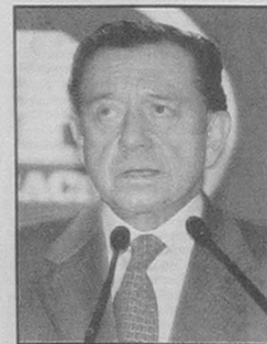
Alemán Velasco asume la responsabilidad junto con Alberto Aza Arias.

Elegido Gobernador de Veracruz en 1988, Alemán Velasco es además empresario y periodista. Entre otros cargos desempeñó el de senador, así como el de asesor del Presidente de la República Mexicana. También fue vicepresidente y presidente ejecutivo del consorcio