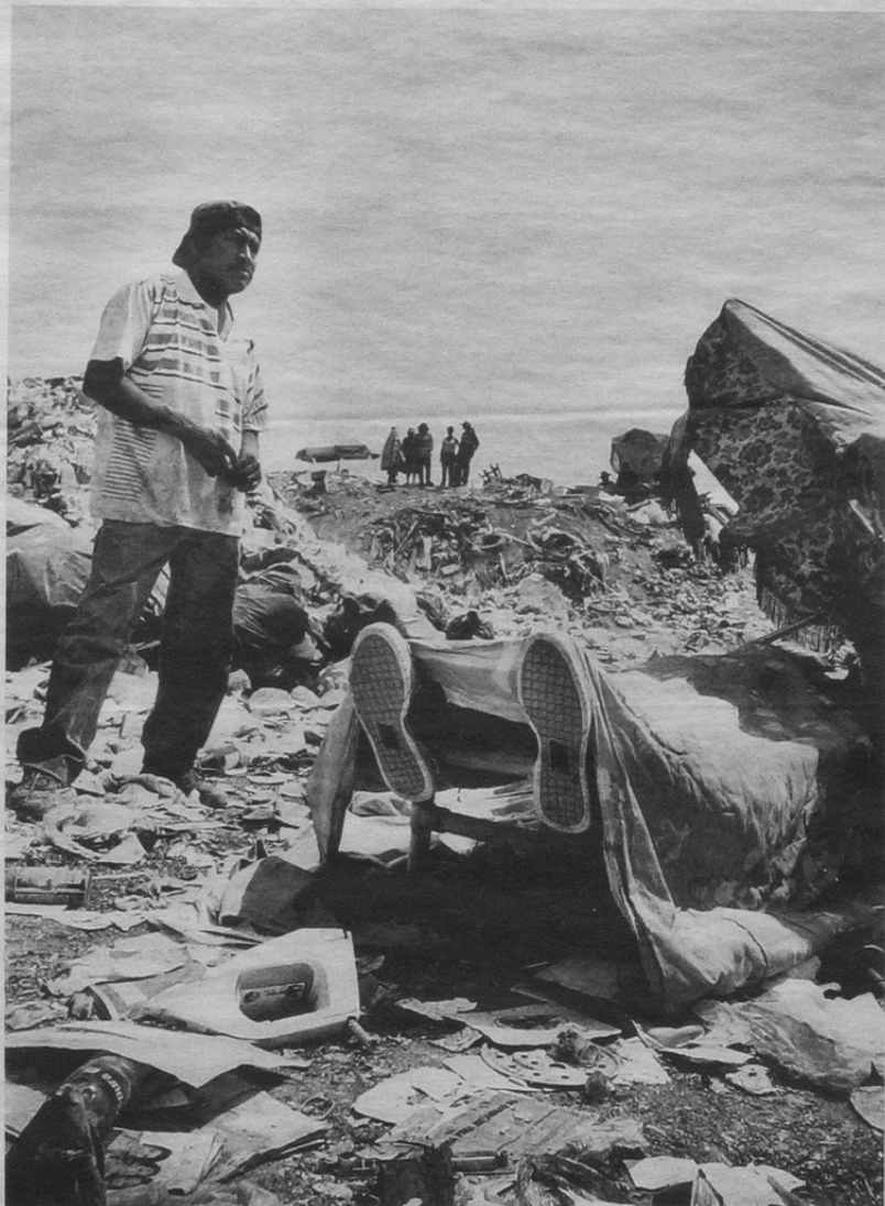
"Chupacabras sista dag".